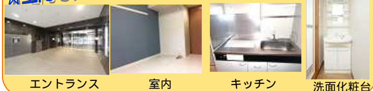
エントランス 室内 キッチン 洗面化粧台