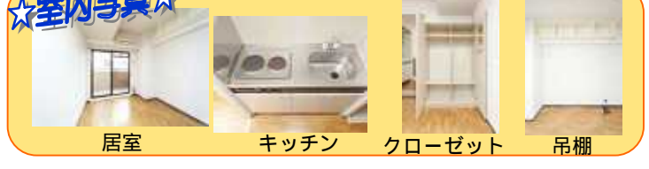
居室 キッチン クローゼット 吊棚