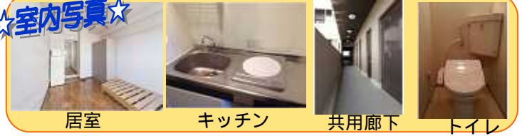
居室 キッチン 共用廊下 トイレ