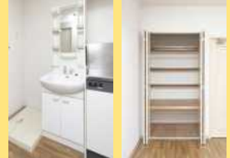
居室 洗面化粧台 クローゼット